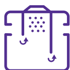
BACS À GRAISSES